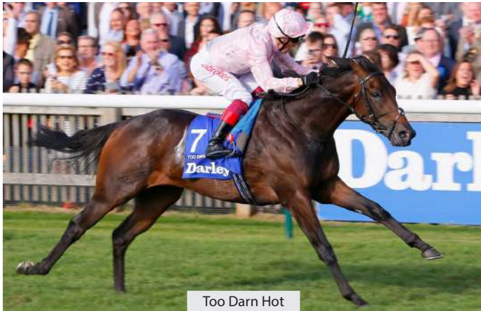
Too Darn Hot

Darley ha decidido enviar a Australia a dos de sus nuevos sementales que más expectativas han generado: Too Darn Hot (Dubawi), campeón de su generación a dos y tres años, y Blue Point (Shamardal), autor de un increíble doblete, con solo cuatro días de diferencia, en Royal Ascot al ganar el King's Stand Stakes y el Diamond Jubilee. En Europa el fee de su primera temporada ha sido de 57.000 y 45.000€, respectivamente. El primero prestará servicio en Kelvinside, a 300 km de Sídney, y el segundo en Northwood Stud, a 120 km de Melbourne. Su fee se anunciará próximamente.